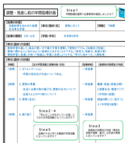
年間指導計画(P3-1 参照)