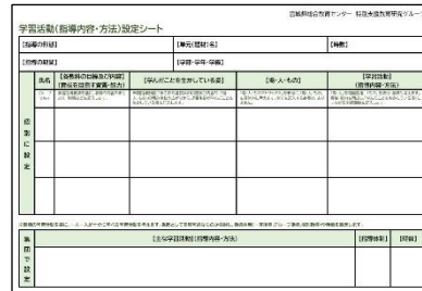
「学習活動(指導内容・方法)設定シート」(P1-13 参照)