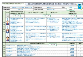
「学習活動(指導内容・方法)設定シート」(P3-3 参照)