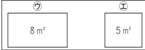
すわっている人数とシートの面積