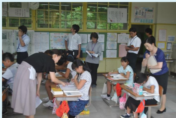
遠刈田中学校，永野小学校からも参観者が来校