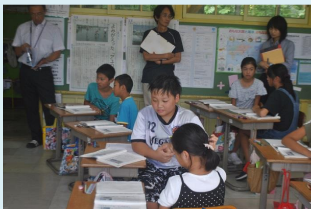
書いた文章を友達と交流