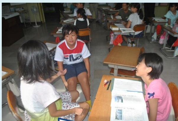
キーワードを手掛かりに，書き手の意図と根拠を話し合う