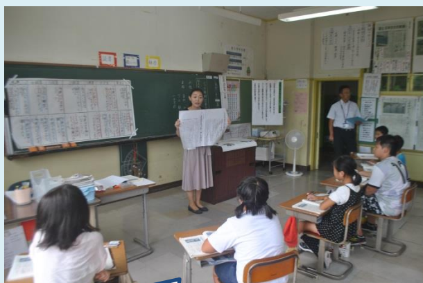
自分の考えを書かせるために文型モデルを活用した指導に取り組んだ授業実践