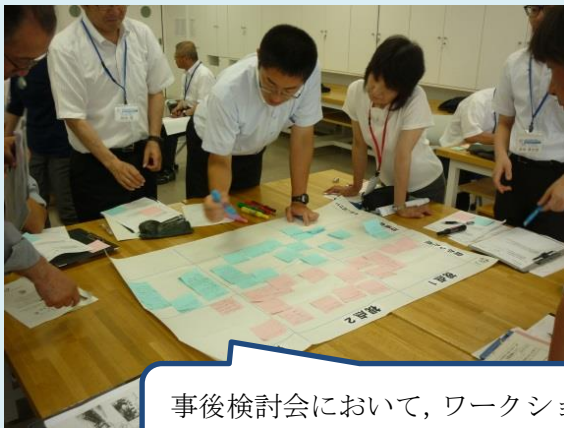
事後検討会において、ワークショップ形式の話合い（金成小中）