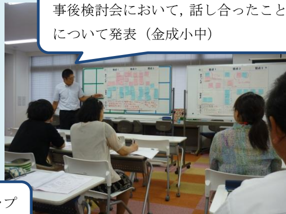
事後検討会において、話し合ったことについて発表（金成小中）